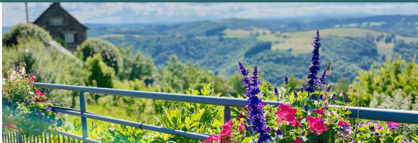
VUE SUR LA VALLÉE DEPUIS LE BOURG DE SAINT-HIPPOLYTE